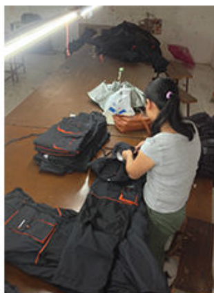
3 Clean up the thread