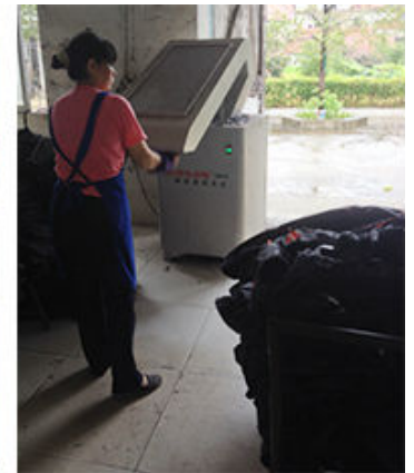
4 Blow the thread