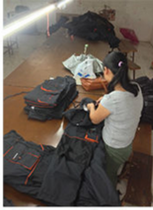
3 Clean up the thread