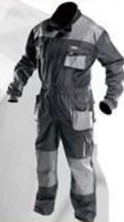
WH290 Coverall 65% polyester 35% cotton High quality