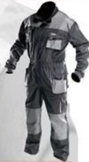
WH290 Coverall 65% polyester 35% cotton High quality