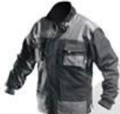
WH290A Jacket 65% polyester 35% cotton High quality