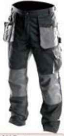
WH290 Pants 65% polyester 35% cotton High quality