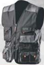
WH290 Vest 65% polyester 35% cotton High quality