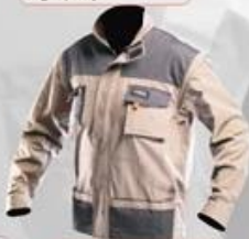
WH290B Jacket 100% cotton High quality