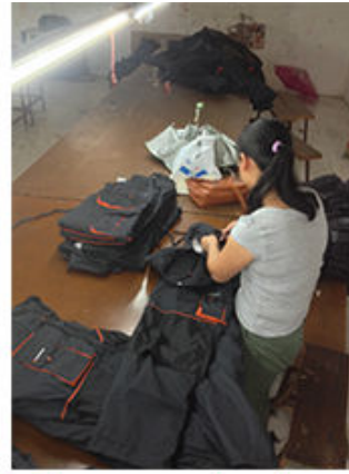
3 Clean up the thread