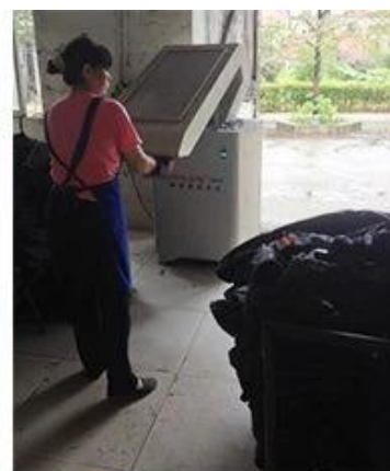
4 Blow the thread