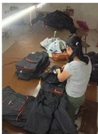
3 Clean up the thread