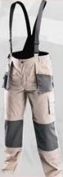
WH290B Bibpants 100% cotton High quality